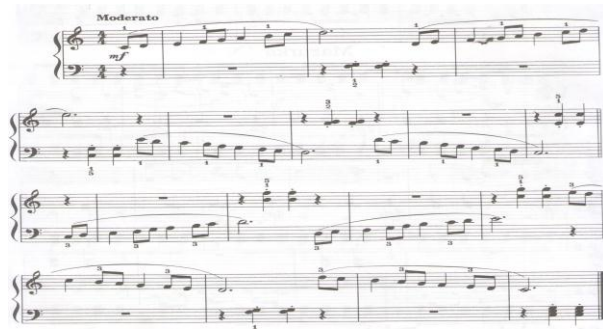
الشكل رقم (٩) يوضح المؤلف بعنوان " وثب سلمي "

يشير المؤلف الى ان المؤلف تمهيد لعزف السلم الكبير وينصح بأداء التمرين في السلالم الكبيرة "صول" ، "ري" ، "مي" ، كما يؤكد على ضرورة استخدام المرونة والتأني اثناء مرور الإبهام اسفل الإصبع الثالث بدون حركة مفاجئة من الرسغ أو الكوع .