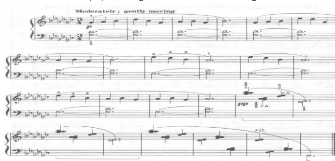
الشكل رقم (٥) يوضح المؤلف بعنوان " معبد ضوء القمر "

على شكل باص متصل، تتسم بالخفوت من ( p ) الى ( pp ) يؤكد استخدام المؤلف مصطلح يدل على أسلوب الأداء بلطف ( Gently moving ) وظهور مصطلح الإبطاء التدريجي مثال الشكل التالي رقم (٥) :