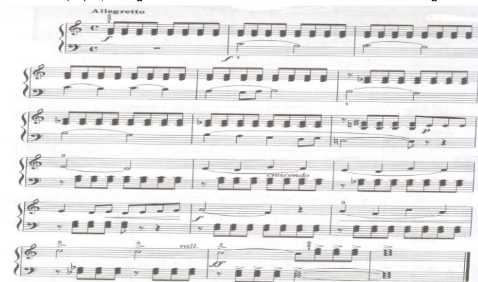
الشكل رقم (٧) يوضح المؤلفة بعنوان " بالاد "

والثانية والرابعة ، تتسم بالتباين بين شدة الصوت (F) والخفوت (P) ثم الى الأكثر شدة (FF)، استخدم المؤلف مصطلحات وعلامات التدرج في الشدة - الإبطاء التدريجي - النبر المفاجئ مثال الشكل التالي رقم (٧) :