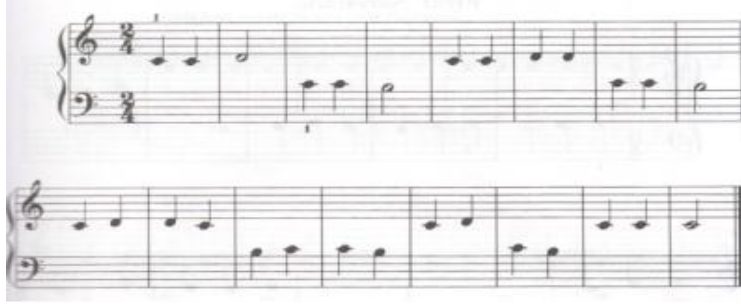
الشكل رقم (١) يوضح تمرين " اهتزاز ثلاث نغمات "

تمرين بعنوان : اهتزاز ثلاث نغمات (Three – Note Jig) : الصيغة أحادية ، الميزان ثنائي بسيط ، تتكون من جملة منتظمة من م. (١ - ٨) وتكرارها من م. (٩ - ١٦) ، الحركة اللحنية عبارة عن تردد ثلاث نغمات محورها نغمة "دو" الوسطى باستخدام الابهام والاصبع الثاني في اليدين ، مثال الشكل التالي رقم (١) :