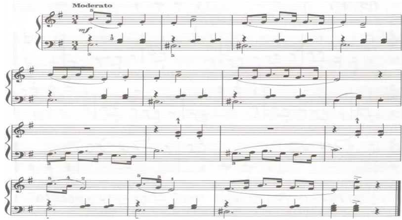
الشكل رقم (٨) يوضح المؤلفه بعنوان " مازوركا "